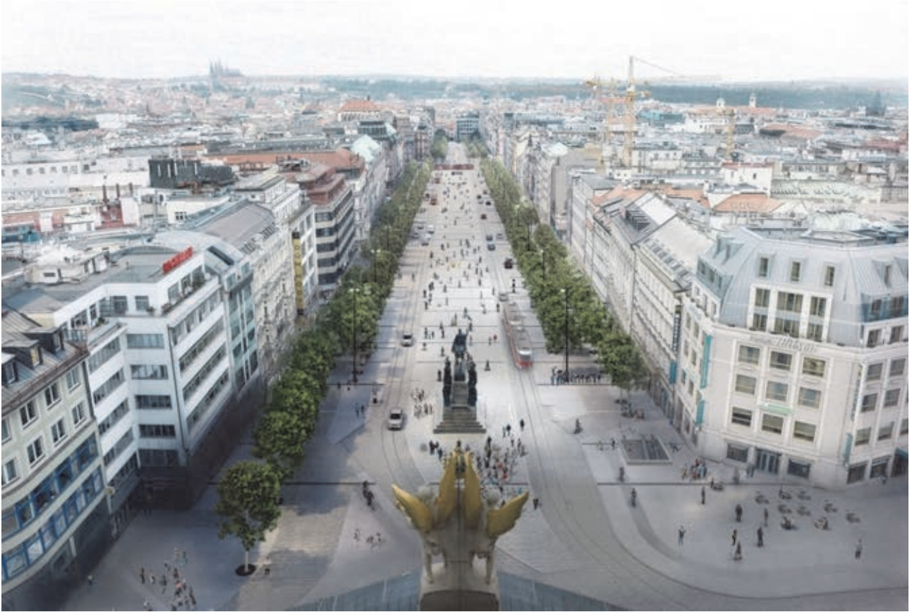
ilustrační obrázek